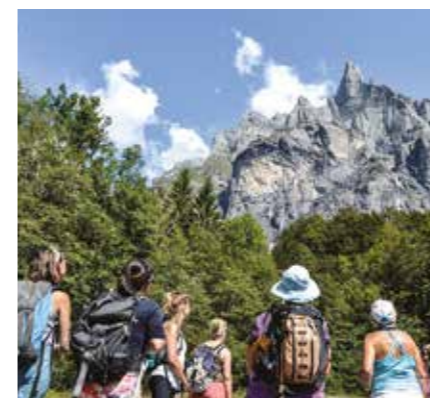
Le Cirque du Fer à Cheval