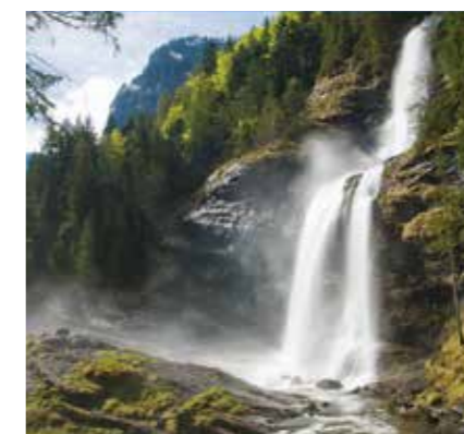
La Cascade du Rouget